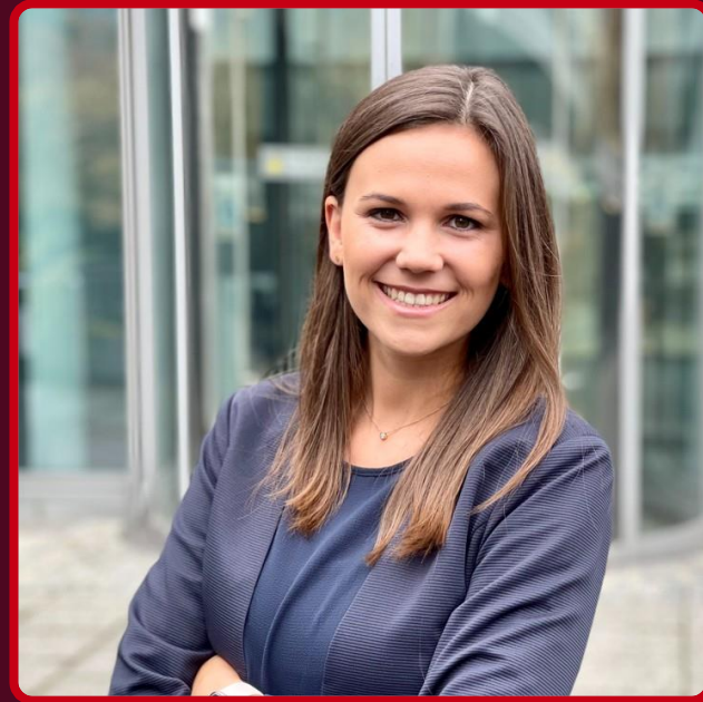
Christin Heinrich DB System GmbH